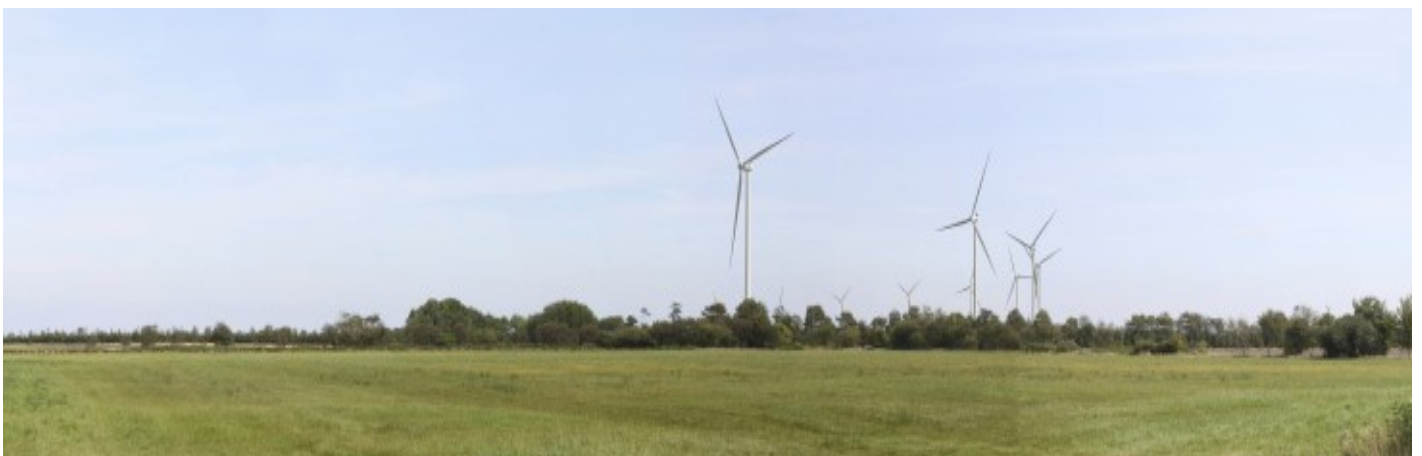
Fotopunkt 2 (se kort på bagsiden) visualisering af vindmølleprojektet med en totalhøjde på 150 meter set fra Vardevej sydvest for vindmølleområdet. Afstanden fra fotostandpunktet til den nærmeste nye vindmølle er ca. 1 km. De to fjerneste vindmøller er næsten skjult bag bevoksningen.

Det skal vurderes hvordan vindmøllerne påvirker kulturlandskabet. Det drejer sig om gravhøje og beskyttede diger samt om påvirkningen af oplevelsen af kirker indenfor en radius på 4,5 km fra vindmøllerne.