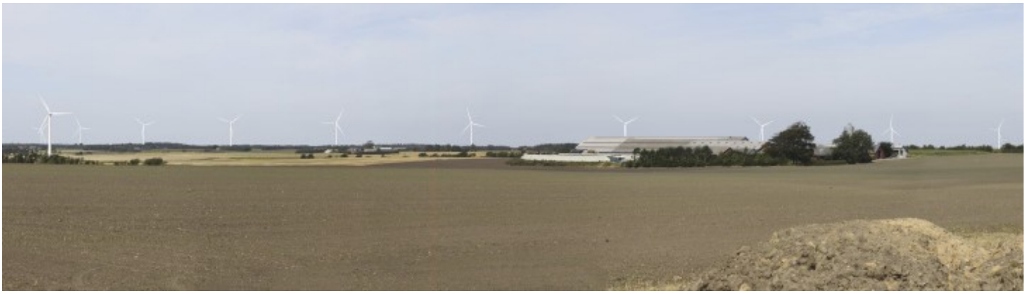
Fotopunkt 1 (se kort på bagsiden) fra fotostandpunktet til vindmøllen ved visualisering af vindmølleparken med en totalhøjde på 150 meter set fra Gunderupvej, syd for vindmølleområdet, nær udkanten af Årre. Afstanden fra fotostandpunktet til den nærmeste nye mølle er ca. 3,4 km. I venstre side af fotoet ses en af seks eksisterende vindmøller ved Engholmvej, afstanden Engholmvej er ca. 1 km